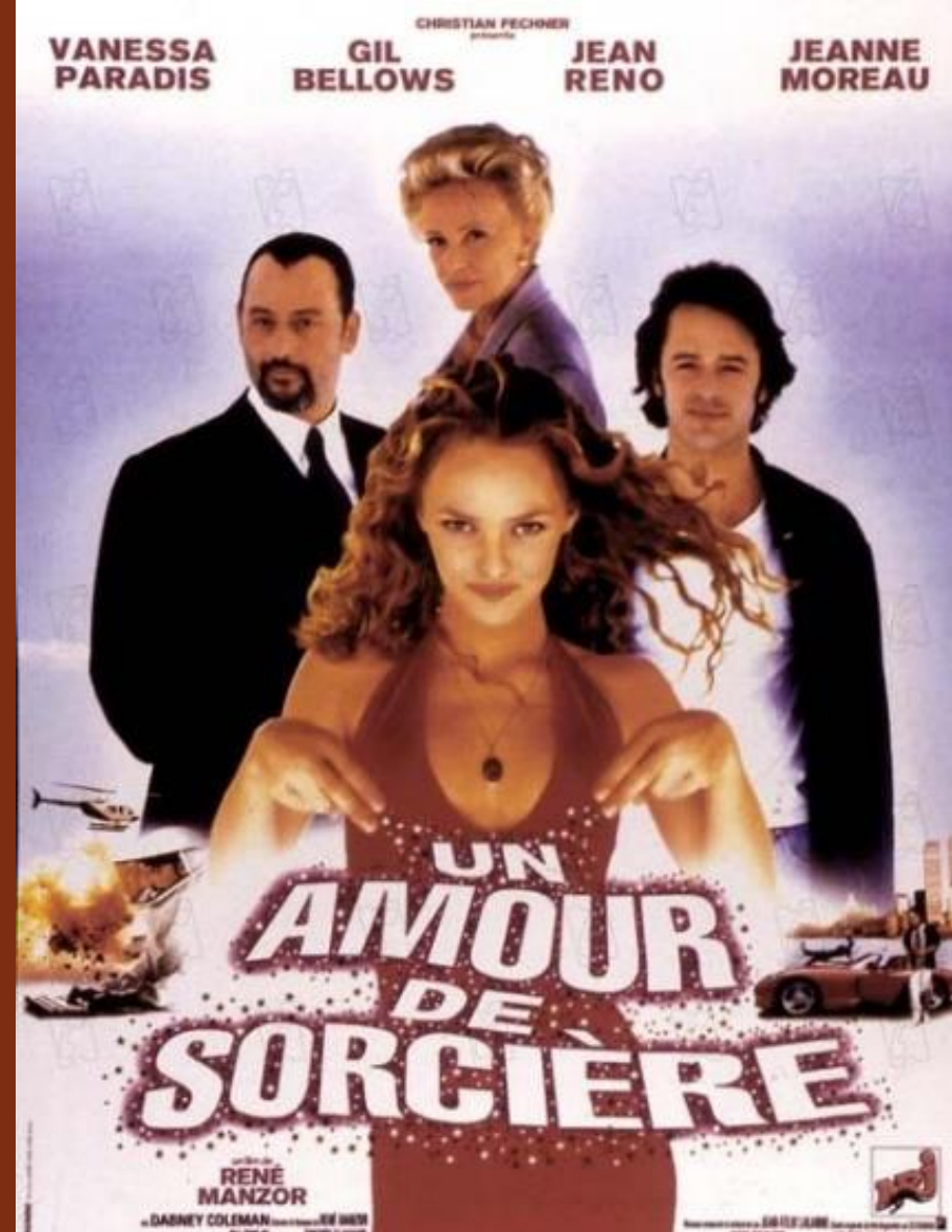
Vanessa Paradis, Jeanne Moreau, Jean Reno De et par René Manzor Film 1997

Morgane, fort jolie sorcière facétieuse, s'est prise de passion pour un naïf inventeur américain, Michael. A peine arrive en France, Michael est envouté par Morgane. Il va être pris en otage dans la lutte sans merci que se mènent les sorciers du bien et les sorciers du ma